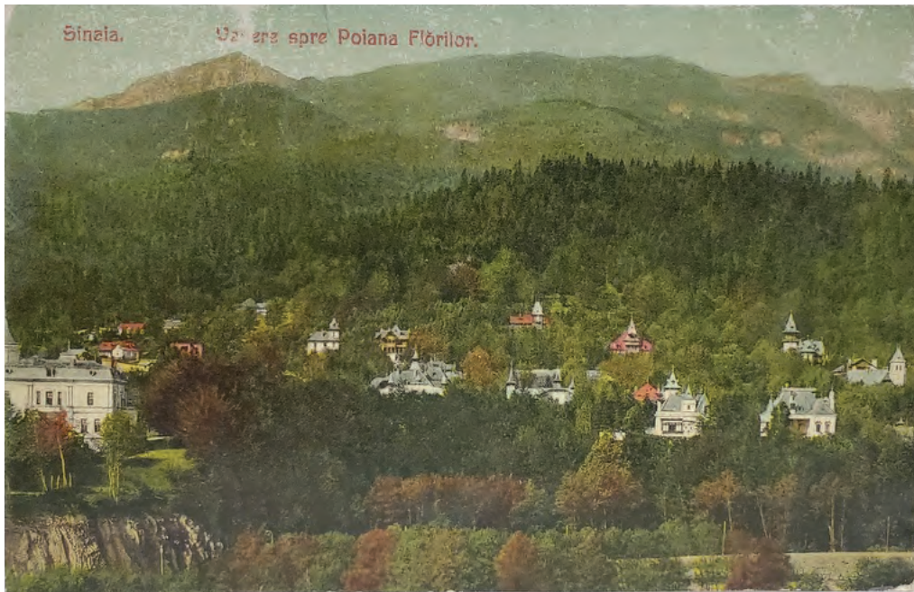
Figura 5. Carte poștală cu vedere spre Poiana Florilor din Sinaia (Editura AD Maier și D. Stern, 1908).