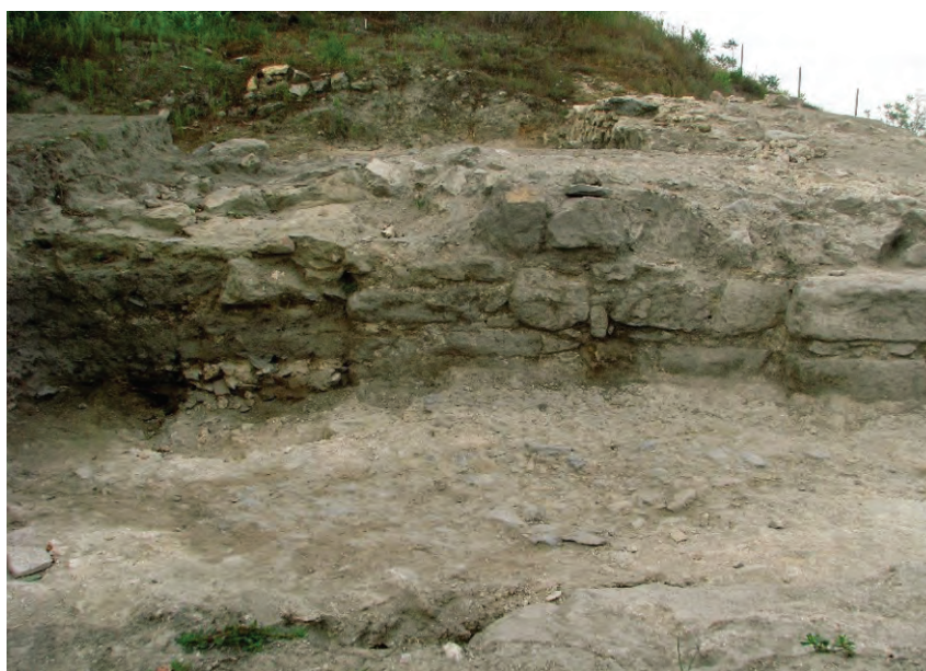
Figura 3. Nufăru – Trecere bac. Vedere asupra unei construcții din piatră, adosată fortificației bizantine în zona turnului-poartă, amplasată intra muros.