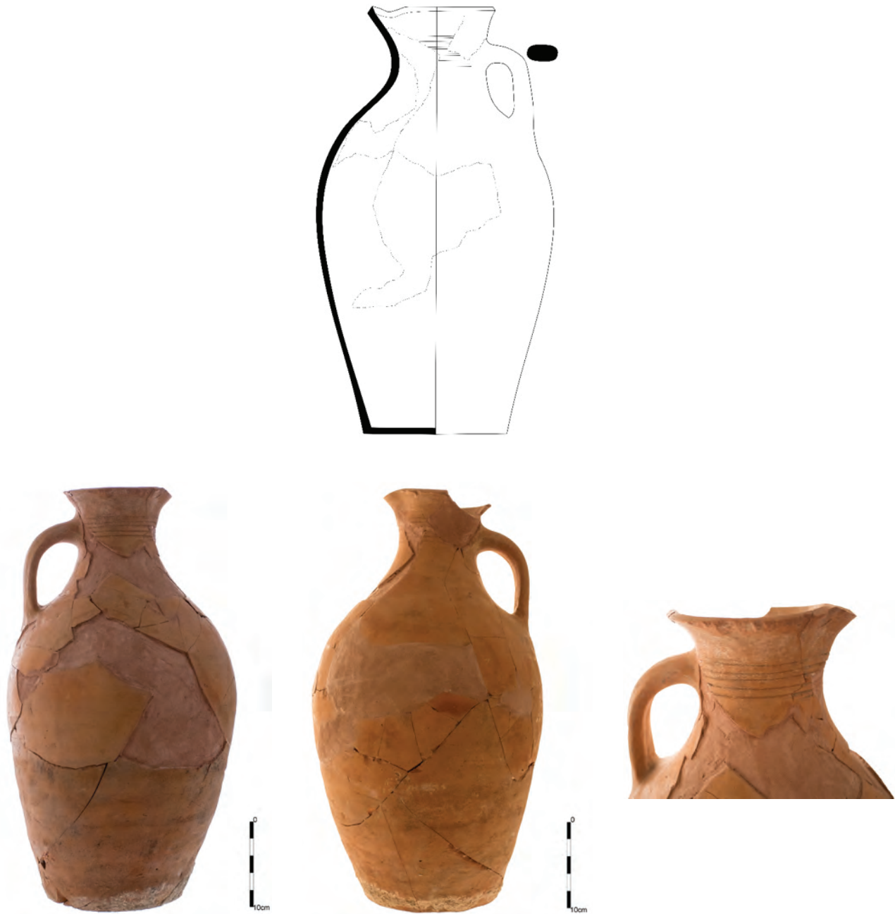
Figura 7. Nufăru – Trecere bac. Urcior amforoidal întregibil (restaurat) din complexul 6/2016. Desen și fotografii.