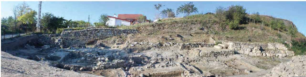
Figura 2. Nufăru – Trecere bac. Curtina de nord a cetății bizantine, cu turnul-poartă și instalația portuară.