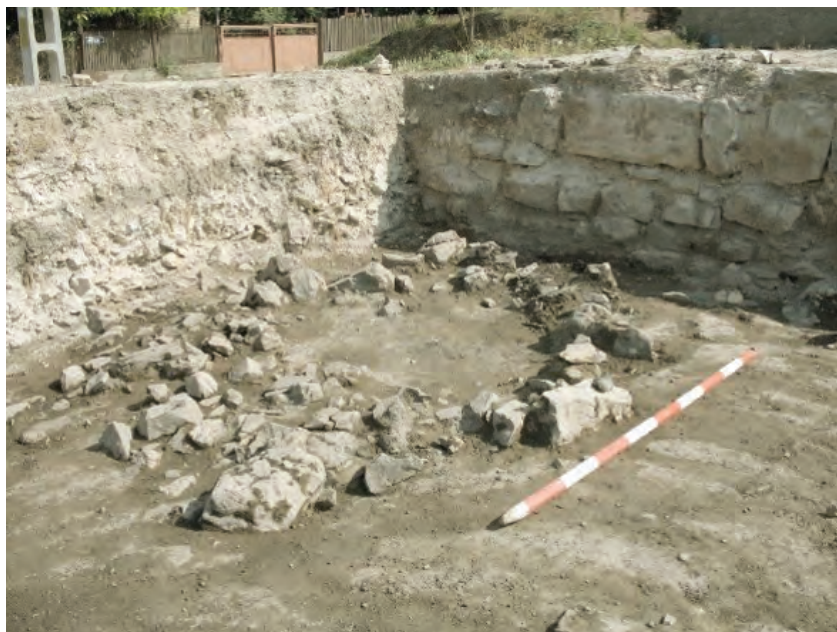
Figura 4. Nufăru – Trecere bac. Vedere asupra unui complex de locuire cu bază de piatră circulară, amplasat extra muros.