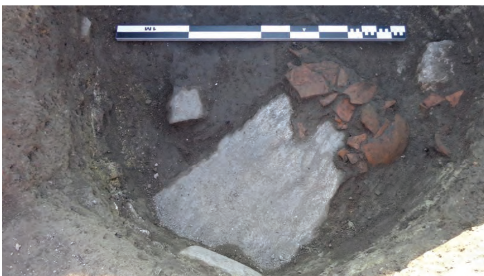
Figura 5. Nufăru – Trecere bac. Complexul 6/2016, cu ceramică în situ. Vedere generală și detalii. Figure 5. Nufăru – Trecere bac. Context 6/2016, with pottery in situ. General view and details.