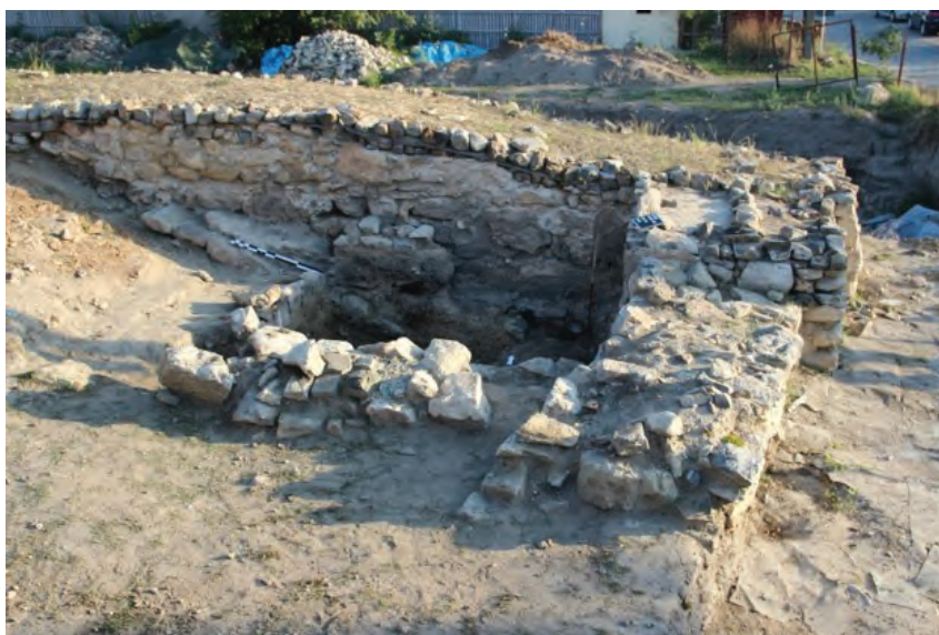
Figure 2. Nufăru – Trecere bac. The northern inner wall, the tower-gate and the wharf.