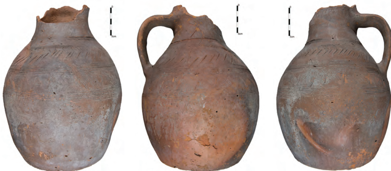
Figura 6. Nufăru – Trecere bac. Urcior amforoidal întreg din complexul 6/2016. Desen și fotografii.