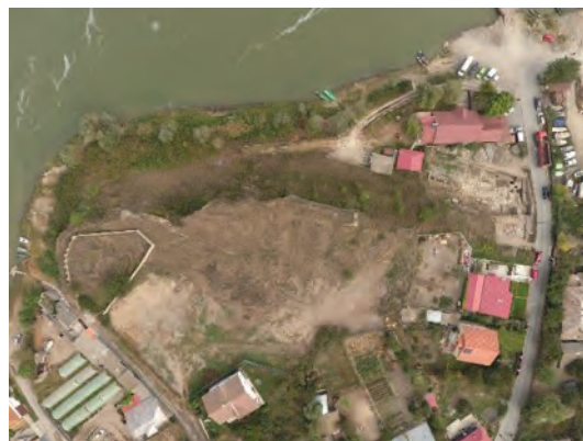
Figura 1. Nufăru. Promontoriu stâncos pe malul drept al brațului Sf. Gheorghe. Punctele „Piatră” și „Trecere bac”.

Identificarea, la sfârșitul anilor '60 ai secolului trecut, a unei categorii ceramice speciale, distincte, gălbuie-roșiatică, în regiunile controlate de Hoarda de Aur 1 , cu precădere în spațiul Moldovei nord-estice 2 , a permis sesizarea difuziunii acesteia și în zona dintre Dunăre și mare 3 . Dosarul „dobrogean” al ceramicii atribuite Hoardei de Aur, în special din categoria gălbuie-roșiatică, deschis de o descoperire izolată de la Păcuiul lui Soare 4 , s-a îmbogățit considerabil prin cercetările arheologice programate și preventive desfășurate în nordul regiunii, completate de descoperiri întâmplătoare. Această categorie ceramică, realizată din pastă gălbuie-roșiatică, roșiatică-gălbuie și cenușie, decorată prin lustruire și incizie sau cu roțița, lucrată în tipare ori smălțuită, incluzând și o serie de vase amforoidale 5 , este considerată proprie culturii materiale a Hoardei de Aur din secolele XIII–XIV, cu semnalări la: Revărsarea – Dealul Tichilești 6 ,