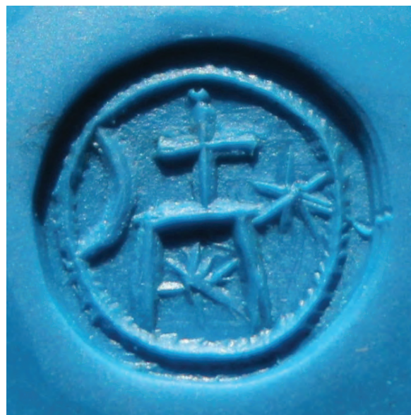
Figura 3. Amprenta sigilară (în plastilină).