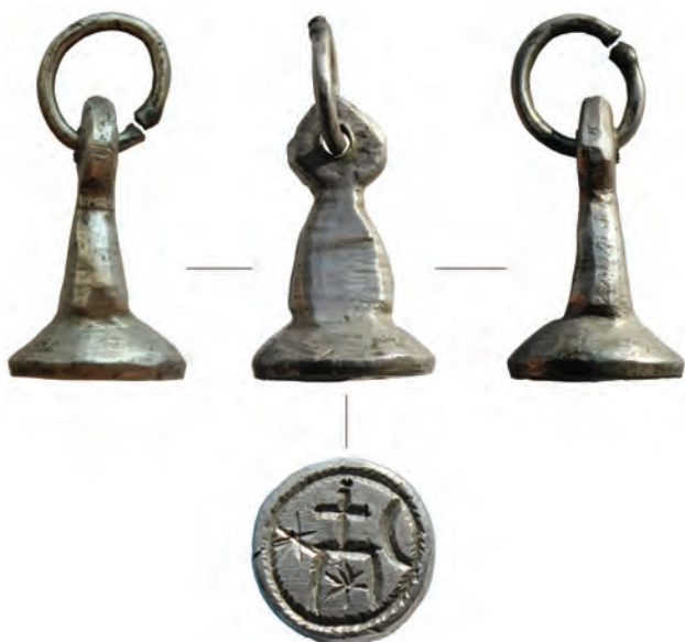
Figura 2. Matrița sigilară.