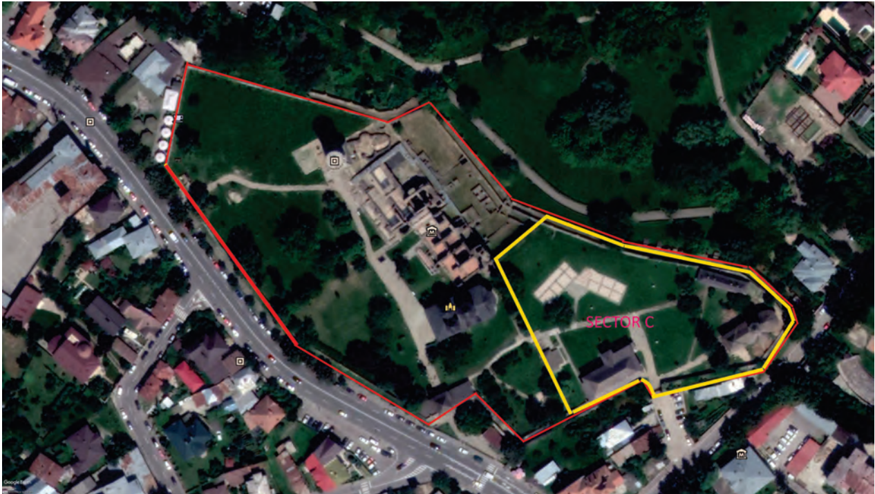
Figura 1. Curtea Domnească din Târgoviște. Vedere aeriană cu marcarea sectorului C de cercetare.

Figure 1. Aerial view of the Royal Court in Târgoviște indicating sector C.